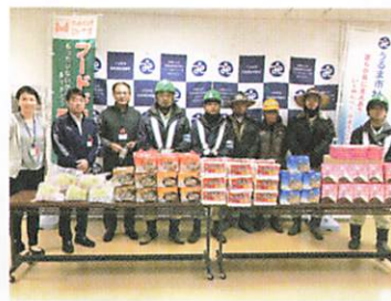
琉球開発株式会社 様