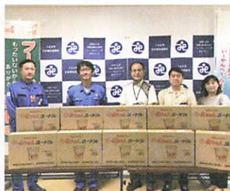
拓南商事株式会社 様