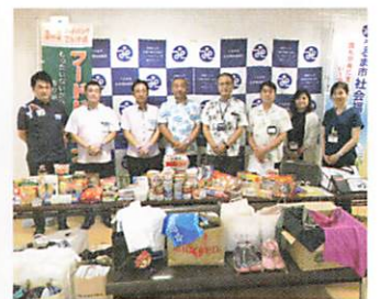
沖縄銀行株式会社（4支店）様