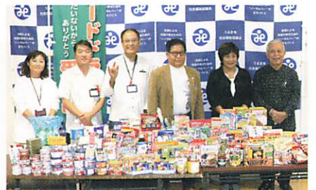
みほそあきない組合 様