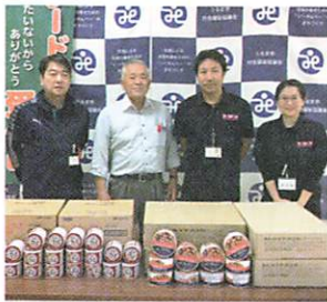
社会福祉法人 緑和会 様