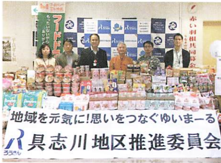
ろうきん具志川地区推進委員会 様

多くの企業、団体や個人よりたくさんの寄贈がありました！ 皆様からのご支援・ご協力、心より感謝いたします。