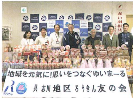
具志川地区ろうきん友の会 様