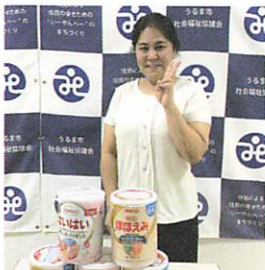
CAFÉ&BAR DonDon 様