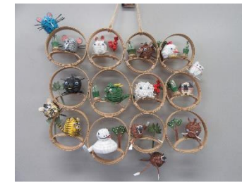
『干支だよ！全員集合』